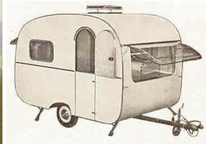
Wolf I 400/450kg ungebremst