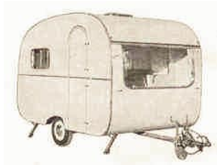
Wolf I 600kg m. Auflauf- und Handbremse